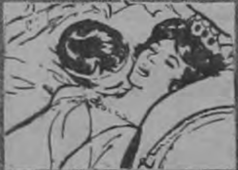
LA HERMOSA, PASIONAL Y TENTADORA HERODIAS