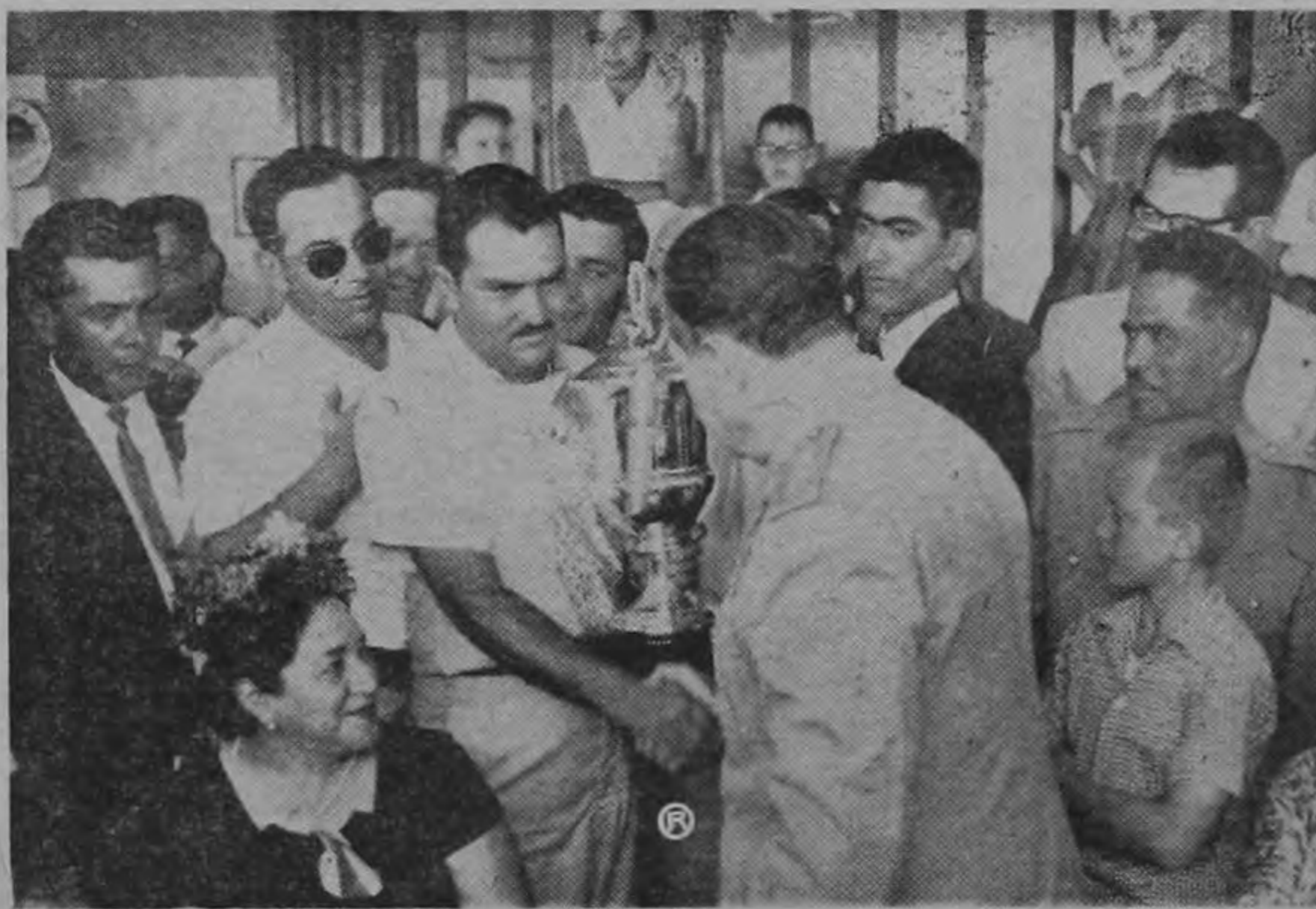
El Sr. Presidente de Guatemala General Ydígoras Fuentes y el Capitán Miguel Angel Castillo se dan la mano, poco después de la entrega del trofeo, cuya leyenda reza: AL CAMPEON CENTROAMERICANO. Observan complacidos, en primer plano a la izquierda la Sra. de Ydígoras Fuentes, ayudantes militares del mandatario y miembros de las delegaciones centroamericanas