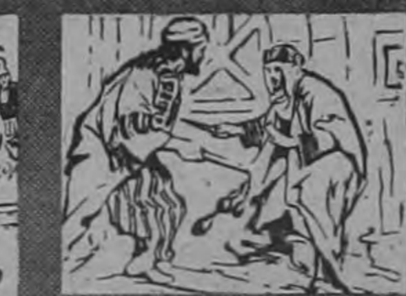
LA EJECUCION DE JUAN BAUTISTA