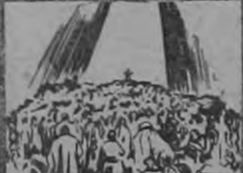
EL MILAGRO DEL SERMON DE LA MONTAÑA