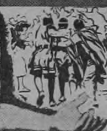
LA VIOLENCIA DE LAS TRIBUS DEL DESIERTO