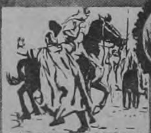
LA EPOCA DE ORO DEL IMPERIO ROMANO

GIGANTE... la película del drama cumbre de la Humanidad GIGANTE... el hombre más grande entre los hombres: Simón, llamado Pedro